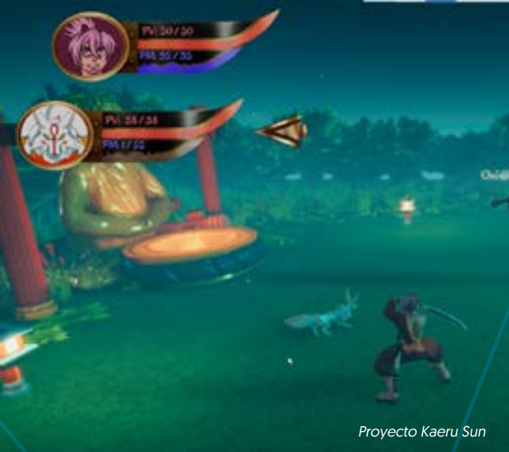
Proyecto Kaeru Sun

Desarrollarás un portfolio jugable de cinco proyectos de videojuegos que servirán para comenzar tu carrera profesional en el sector.