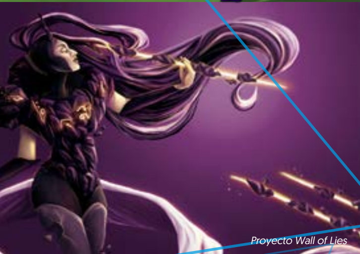
Proyecto Wall of Lies